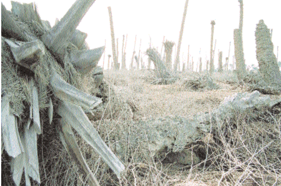
■ الصور بعدسة الفنان العراقي احسان الجيزاني

■ شامخة فرعاء تحطر خصل سفعها بالماء بجلة والفرا، وتكمل عيونها بتراب العراق، هي عمتها التي أكثرها الله، وهي التي تساقطت خيرا وعافية على مريم العذراء. هي الحضارة التي عمرها كل البشرية، انها النخلة التي يحبها العراقيون مثل آبائهم حتى عندما سئل أحدهم أي الأشياء أحب إليك، قال النخلة، لأن منها نأكل التمر، ومنها نصنع أدواتها، ومنها عمد بيوتنا والعراق بلد أكثر من مليون نخلة وعانت فيه سيد الشجر حملة لإزالتها من جذورها حتى لم يبق إلا القليل وأصبحت بسايتها عبارة عن مقابر جماعية، حيث الرؤوس المقطوعة والجذور متناثرة هنا وهناك، حملة استهدفت اقتلاع الخير من ربوع العراق، كما جففت الأهوار وأصبح الإنسان عبارة عن عظام ورفاة وأرقام مجهولة لاتعرف أسماءهم. عام ١٩٩٦ شهد العراق أوسع حملة لإبادة بساتين النخيل في جنوب العراق بحجة إيواء المعارضة، وبالأخص في زيارته الأمراض التي زادت من معاناة عمتها وأصبحت تسقط على الأرض وهي شامخة دون حراك وهذا الموضوع شد الكثير من الفنانين والكتاب لتصوير هذه الحالة ولكن الصور الفوتوغرافي العراقي المغرب احسان الجيزاني الذي زار العراق عدة مرات وبالأخص في زيارته الأخيرة قبل شهر جسد هذه المعاناة ونقلها إلى جميع العالم، فكان خير محام من أم الشجر، وهو يرى حالها وما وصلت إليه من هلاك وموت جماعي.